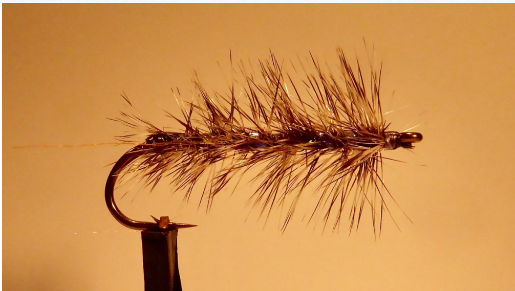
Gebunden von Robert